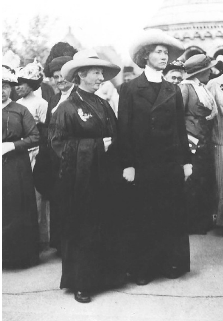
Abb. 4: Anita Augspurg (links) und ihre Lebensgefährtin Lida Gustava Heymann auf dem Budapest Congress für Frauenrechte 1913

Trotzdem ging es Anfang des letzten Jahrhunderts vorwärts mit den Frauenrechten. 1908 wurde ein Vereinsgesetz verabschiedet, das allen Reichsangehörigen das Recht gab, Vereine zu bilden und sich zu versammeln. Ab jetzt konnten Frauen Parteien beitreten, aktiv Parteipolitik betreiben und sich verstärkt dem Kampf für eine freie politische Betätigung und ihr Wahlrecht widmen.