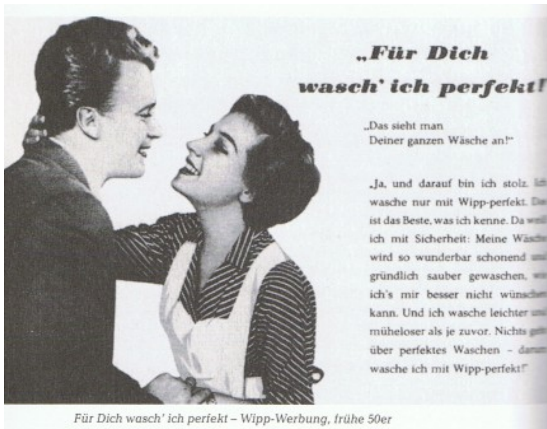
Abb. 9: Perlonzeit. Wie die Frauen ihr Wirtschaftswunder erlebten, Elefanten Press 1985

Immerhin gelingt auf Druck der außerparlamentarischen Opposition das Gesetz über die Gleichberechtigung von Mann und Frau, es tritt am 1. Juli 1958 in Kraft. Wichtigste Punkte sind das Recht der Frau, das eigene Vermögen zu verwalten, der Wegfall des Alleinentscheidungsrechts des Mannes in der Ehe und die Einschränkung – nicht vollständige Beseitigung – väterlicher Vorrechte in der Kindererziehung. Eine wirkliche Rechtsgleichheit zwischen den Geschlechtern ist noch nicht erreicht (Abb. 10, im Vergleich dazu ein Plakat aus der DDR von 1950, Abb. 11).