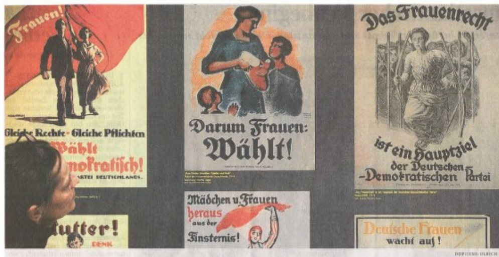
Abb. 5: Wahlplakate 1919

Bekanntlich wurden viele Errungenschaften der Weimarer Republik unter den Nationalsozialisten ab 1933 wieder rückgängig gemacht. Für die Frauen wurde diese Zeit zu einem riesigen Schritt zurück in der Springprozeession. So wurde neben vielen anderen frauenfeindlichen Maßnahmen ihnen das passive Wahlrecht wieder aberkannt.