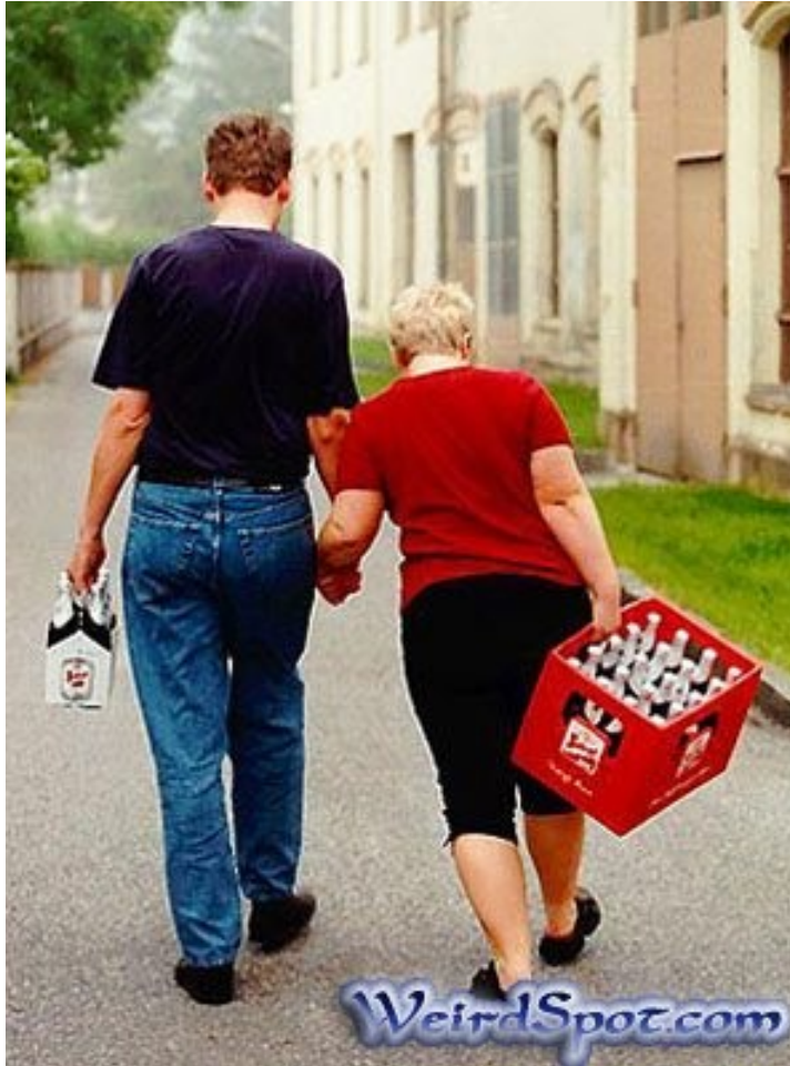
Abb. 12: Es gibt noch viel zu tun!

Zum Weiterlesen sowie Nachweis der Zitate: