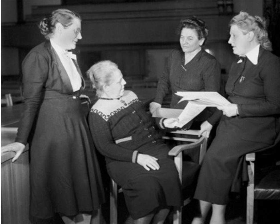
Abb. 7: Die vier „Mütter des Grundgesetzes“, v.l.: Nadig, Weber, Wessel, Selbert, 1948/9 im Parlamentarischen Rat

Eine erste Version für ein Gleichstellungsgesetz lautete: „Alle Menschen sind vor dem Gesetz gleich. Das Gesetz muss Gleiches gleich, es kann Verschiedenes nach seiner Eigenart behandeln.“ Selbert erkannte früh: „Der Ungleichbehandlung von Frauen wären mit Verweis auf die biologischen Unterschiede zwischen den Geschlechtern juristisch Tür und Tor geöffnet.“ Deshalb beantragt sie die Änderung in „Männer und Frauen sind gleichberechtigt“. Aber die vier „Mütter“ des Grundgesetzes waren sich in der Frage der Gleichberechtigung nicht einig. Helene Wessel und Helene Weber wollten Artikel 3 aus der Weimarer Verfassung unverändert beibehalten. Auch Selberts Parteikollegin Friederike Nadig war gegen diese allgemeine Formulierung, allerdings mit der Begründung, dass das Familienrecht des BGB damit verfassungswidrig würde. Sie warnte vor einem „Rechts-Chaos“. Aber mit der Zeit dämmert es ihr, dass Elisabeth Selbert genau dies bezweckte. Selbert wollte, dass das erzpatriarchale deutsche Familienrecht durch so ein „Rechts-Chaos“ endlich abgeschafft würde.