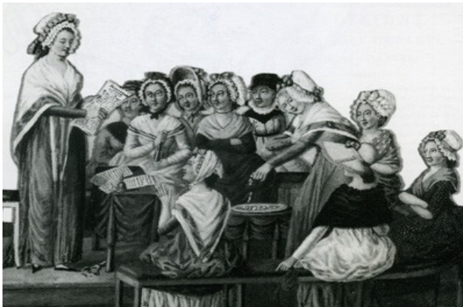
Abb. 2: ein revolutionärer Frauenclub 1791, so könnte Olympe de Gouges Proklamation der Frauenrechte ausgesehen haben

1791 formulierte dann Olympe de Gouge die „Die Erklärung der Rechte der Frau und Bürgerin“. (Abb. 2). Der Kampf der Frauen beschränkte sich aber nicht nur auf Worte und Proklamationen. Theroigne de Méricourt (Abb. 3) rief den Frauen zu: „Frauen – bewaffnen wir uns“. In den Revolutionskriegen 1792 bildeten sich Amazonenlegionen, die lautstark ihre Teilnahme am Krieg einforderten. Darüber hinaus wurden Frauenclubs und patriotische Gesellschaften sowie Zeitschriften für Frauen gegründet.