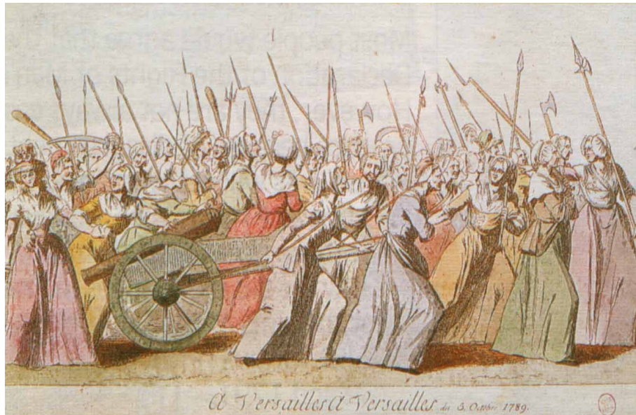
Abb. 1: „à Versailles, à Versailles“, Der Zug der Marktfrauen nach Versailles am 2. Oktober 1789

1791 formulierte dann Olympe de Gouge die „Die Erklärung der Rechte der Frau und Bürgerin“. (Abb. 2). Der Kampf der Frauen beschränkte sich aber nicht nur auf Worte und Proklamationen. Theroigne de Méricourt (Abb. 3) rief den Frauen zu: „Frauen – bewaffnen wir uns“. In den Revolutionskriegen 1792 bildeten sich Amazonenlegionen, die lautstark ihre Teilnahme am Krieg einforderten. Darüber hinaus wurden Frauenclubs und patriotische Gesellschaften sowie Zeitschriften für Frauen gegründet.