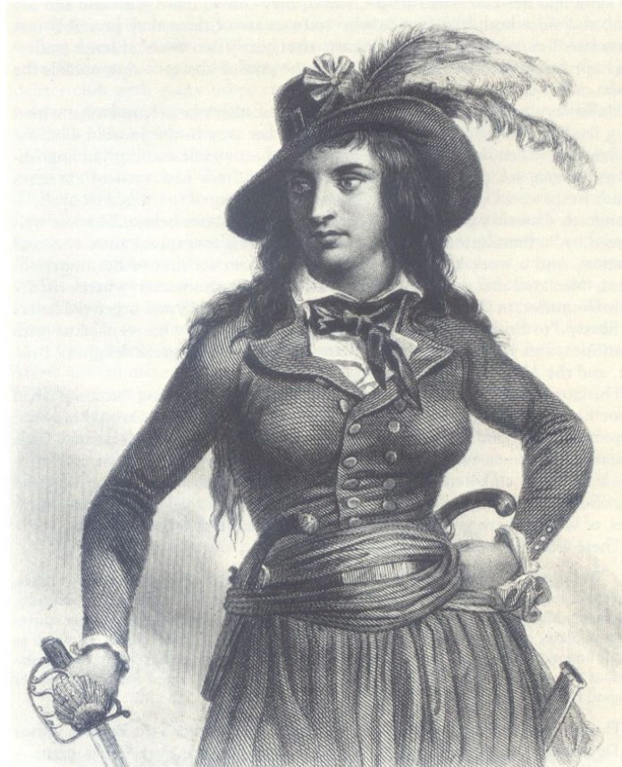
Abb. 3: Théroigne de Méricourt, um 1830

Trotzdem – oder vielleicht deshalb? – schloss die neue republikanische Verfassung von 1793 Frauen von allen politischen Rechten aus. Die Frauenclubs wurden verboten und Olympe de Gouge hingerichtet. Aber die Frauen wehrten sich. 1795 initiierten sie die Stürmung des Konvents. Worauf die Regierung vier Tage später ein Versammlungsverbot für Frauen verhängt. Und 1807 legte das Gesetzbuch des Code civil die Vormundschaft des Ehemannes über seine Frau fest.