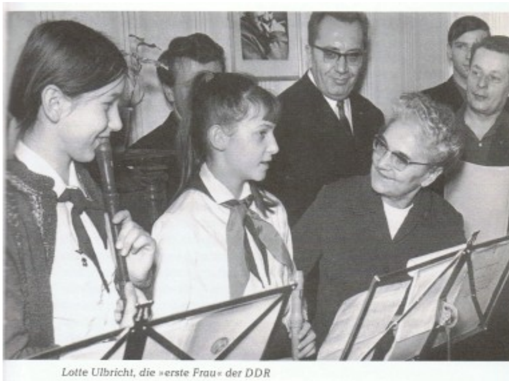
Abb.: Lotte Ulbricht

Immerhin wurde in der DDR eine weitgehende, nicht vollständige, Gleichstellung in der Erwerbsarbeit erreicht. Die notwendigen Voraussetzungen wurden geschaffen durch Frauenqualifizierung, soziale Dienste in den Betrieben und Kinderbetreuung. Ende der 80er Jahre waren mehr als 90 % der Frauen im Erwerbsalter berufstätig (BRD: bei ca. 55 %).