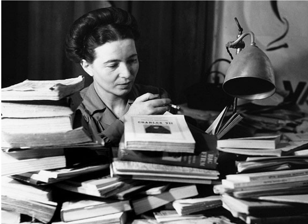
Abb. 6: Simone de Beauvoir, um 1945

Nach dem Krieg gestalteten sich die frauenpolitischen Anfänge in der östlichen und den westlichen Besatzungszonen im Prinzip ähnlich. Die Infrastruktur war zerstört, es herrschte kriegsbedingter Männermangel – bezeichnenderweise „Frauenüberschuss“ genannt. Frauen übernahmen auf beiden Seiten politische Verantwortung, räumten die Trümmer weg, gründeten eigene politische Strukturen (Frauenausschüsse).