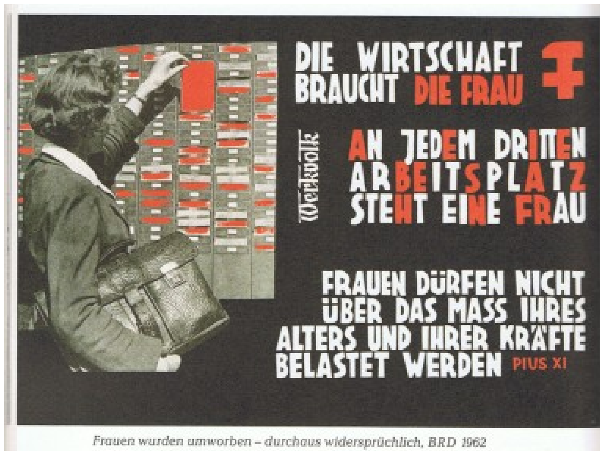
Abb. 10: Plakat Bundesrepublik Deutschland 1962